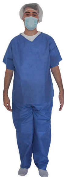
Azul, dos piezas