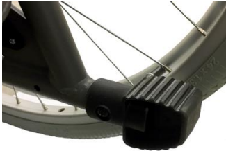
Tubos de cola