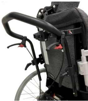
Asa de empuje única