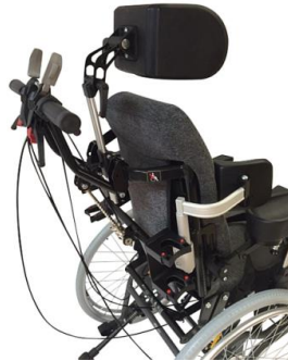
Asa ajustable en ángulo