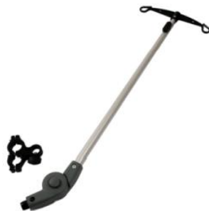
Soporte de gotero