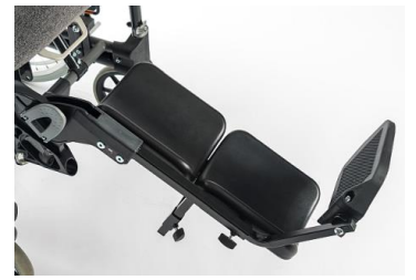
Soporte de escayola