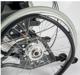
Ruedas con frenos de tambor