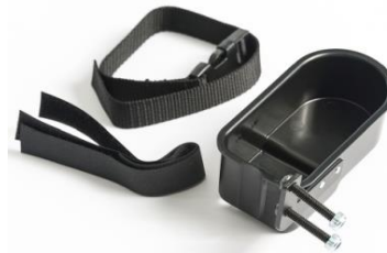
Soporte de bastones