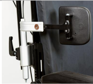
SopORTE torácico ajustable en profundidad