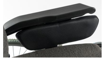
Funda protector lateral acolchado completo