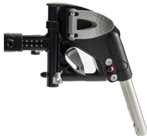
Reposapiés de aluminio elevables