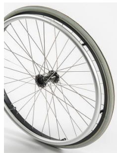
Ruedas 36 radios