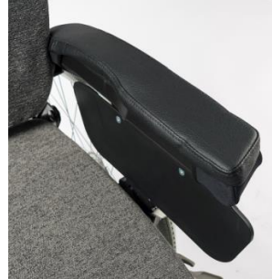
Funda acolchada para almohadillado