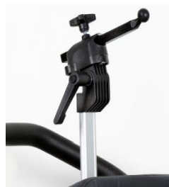
Montaje Reposacabezas Whitmyer