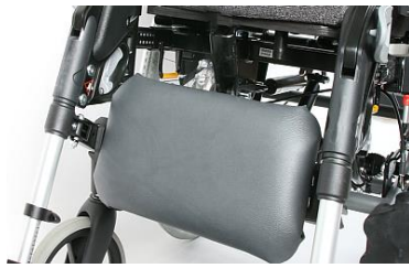
Almohadilla única para pantorrillas