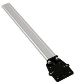
Fijación universal reposacabezas