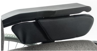
Funda protector lateral mitad acolchada