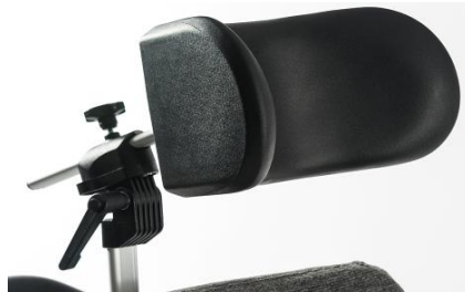
Reposacabezas con soportes laterales