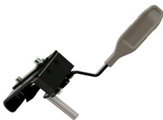
Freno de empuje