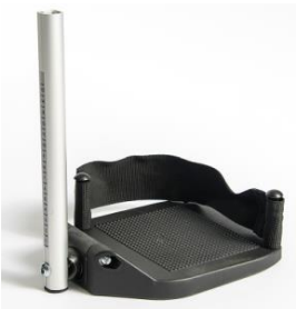
Plataformas de composite