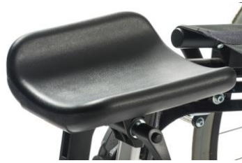
Soporte de amputado