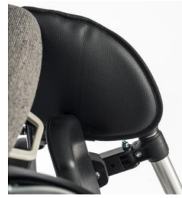
Protección para rodilla