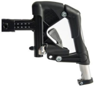
Reposapiés de aluminio