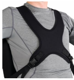
Peto Clásico dinámico