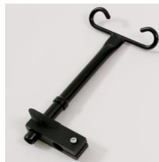
Soporte bombonas oxígeno