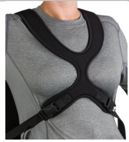
Peto Contour dinámico