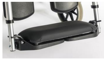
Almohadilla para plataformas